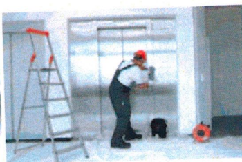
Servis 24 hodin