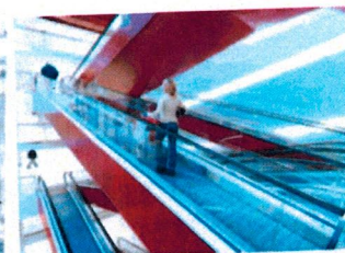
Eskalátory & pohyblivé chodníky