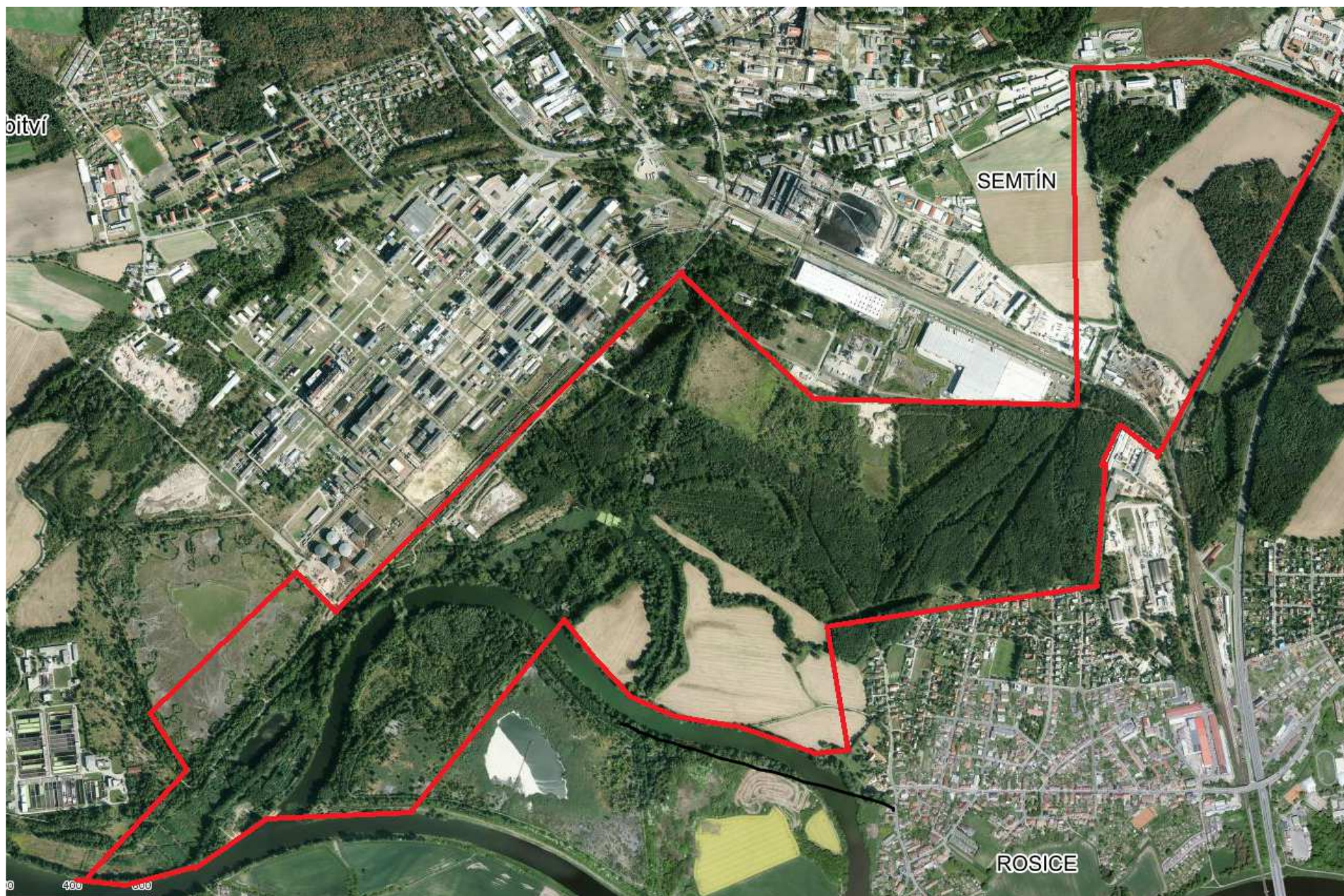
Příloha č. 2 - Situace záměru Veřejný přístav Pardubice – severní část