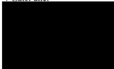
provozně ekonomický ředitel