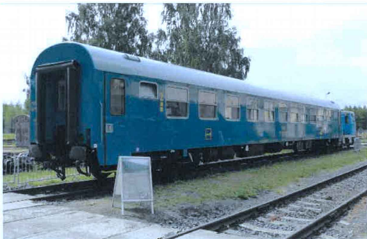
2. Lehátkový vůz s bufetovým oddílem BRcm 51 54 55-80 049-7