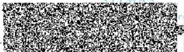
jednatel společnosti STIMAX International, s.r.o.