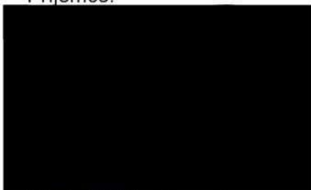
Bc. Judita Soukupová místopředsedkyně