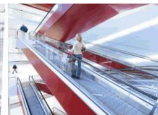
Eskalátory & pohyblivé chodníky