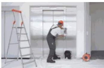
Servis 24 hodin