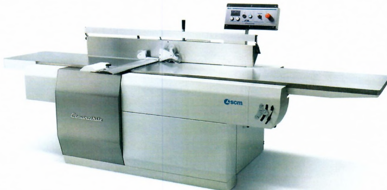
Ilustrační foto stroje