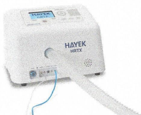
Hayek HRTX pro domácí péči