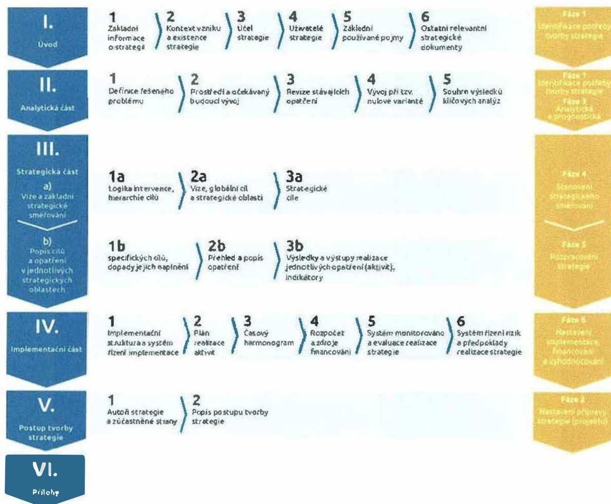
Obr. 1: Metodika přípravy veřejných strategií, aktualizovaná verze schválená usnesením vlády ČR č. 71 ze dne 28. ledna 2019.

Z metodologického pohledu bude dokument zpracován v souladu s doporučeními Metodiky přípravy veřejných strategií (Ministerstvo pro místní rozvoj 2018, v rozsahu znění aktualizované verze schválené usnesením vlády č. 71 ze dne 28. ledna 2019).