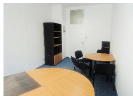
kancelářský nábytek prostor 254