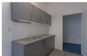
kuchynka prostor 269 - nábytek