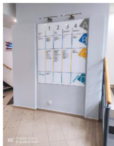
informační systém v budově