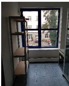
regálový systém prostor 275