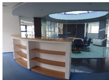
policový nábytek prostor 541