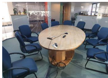
zasedací místnost 541- vybavení nábytkem