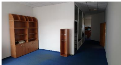
policová sestava prostor 414