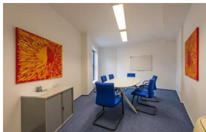
vybavení zasedačky-nábytek v prostoru 368