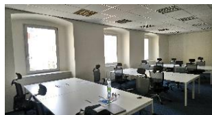
Pracovní stůl NOVA U bílý - prostor 249