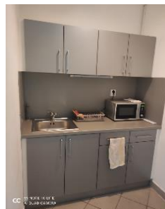
společná kuchynka na každém patře