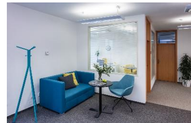
vybavení sofa a nábytek, vstup prostory 480