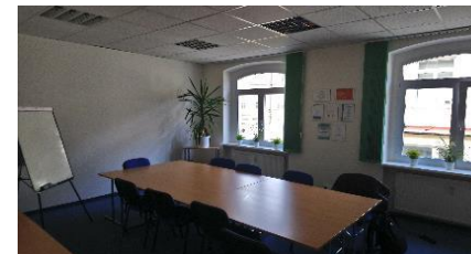
vybavení zasedací místnosti 438 - nábytek