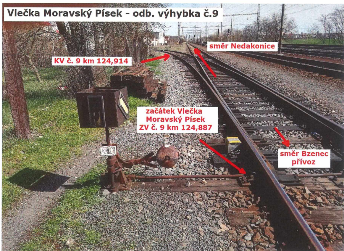
2. fotodokumentace zachycující předmět daru v terénu