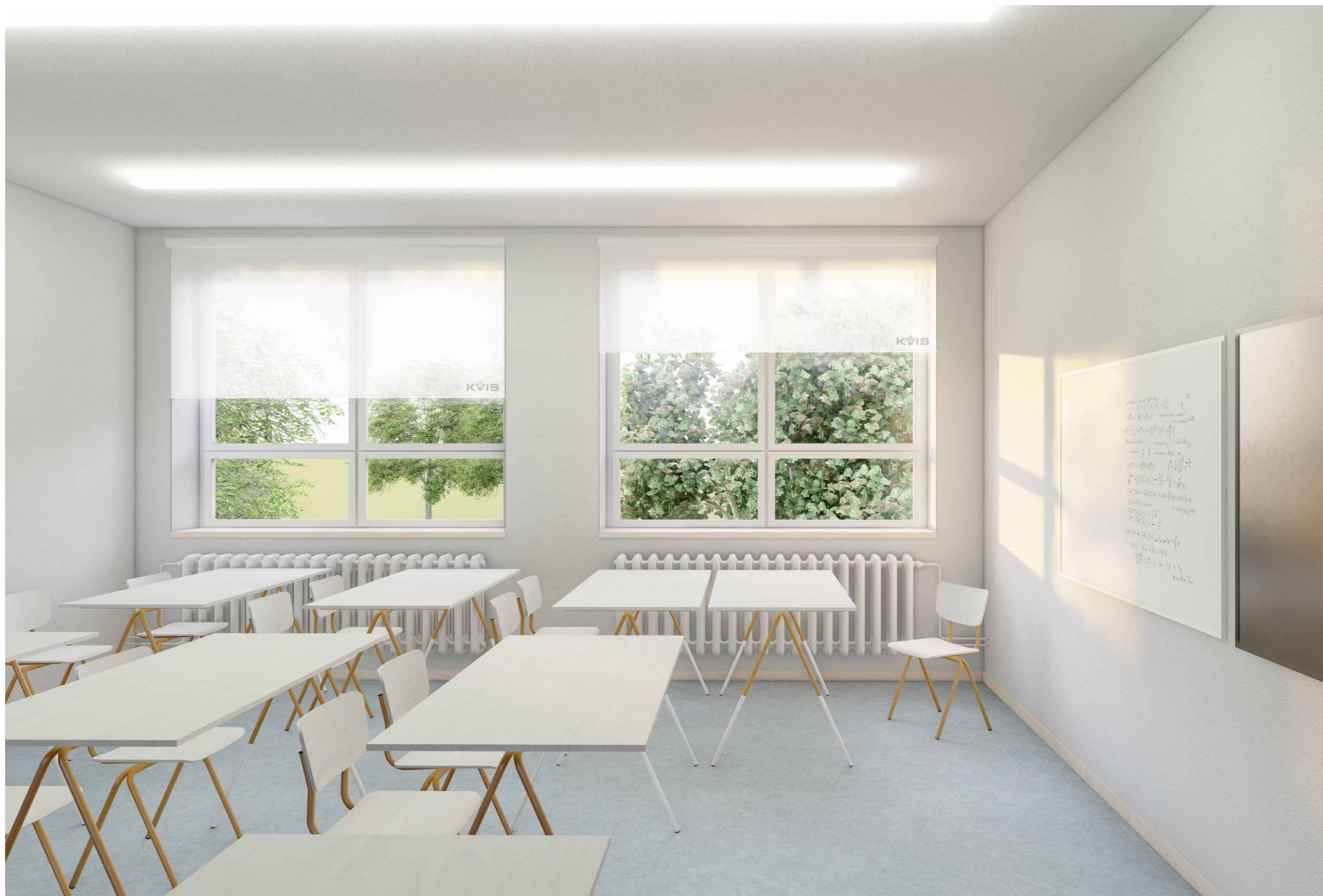
NÁVRH #03 UČEBNY STAVEBNÍ ŠKOLY VE VYSOKÉM MÝTĚ FINANCOVANÉ SPOLEČNOSTÍ KVIS PARDUBICE A.S.