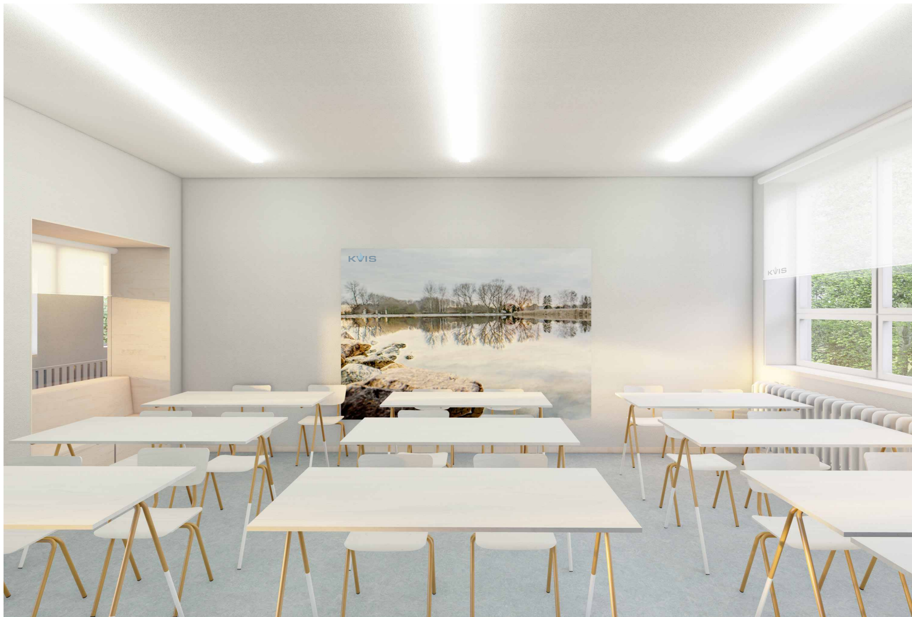
NÁVRH #03 UČEBNY STAVEBNÍ ŠKOLY VE VYSOKÉM MÝTĚ FINANCOVANÉ SPOLEČNOSTÍ KVIS PARDUBICE A.S.