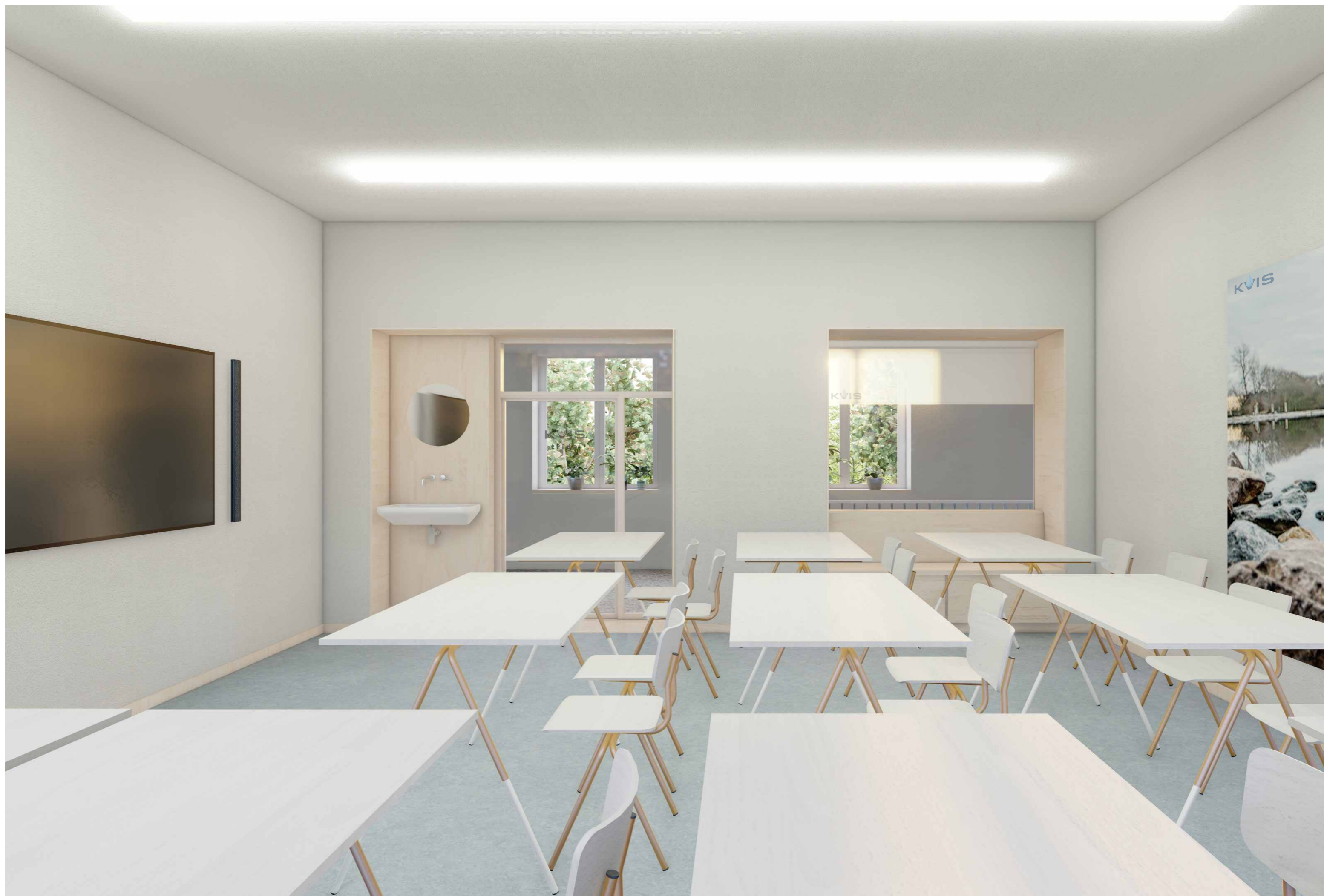
NÁVRH #03 UČEBNY STAVEBNÍ ŠKOLY VE VYSOKÉM MÝTĚ FINANCOVANÉ SPOLEČNOSTÍ KVIS PARDUBICE A.S.