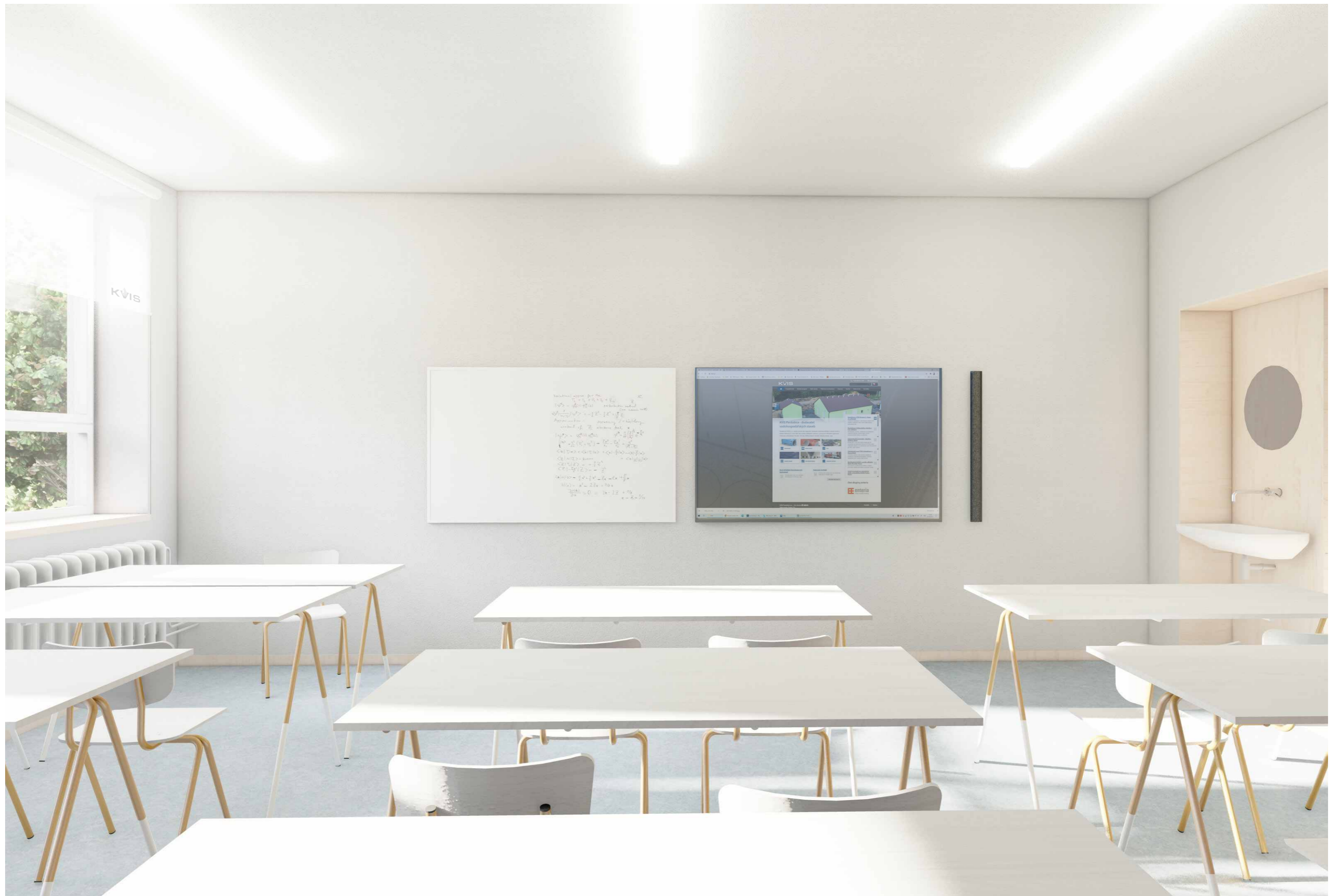
NÁVRH #03 UČEBNY STAVEBNÍ ŠKOLY VE VYSOKÉM MÝTĚ FINANCOVANÉ SPOLEČNOSTÍ KVIS PARDUBICE A.S.