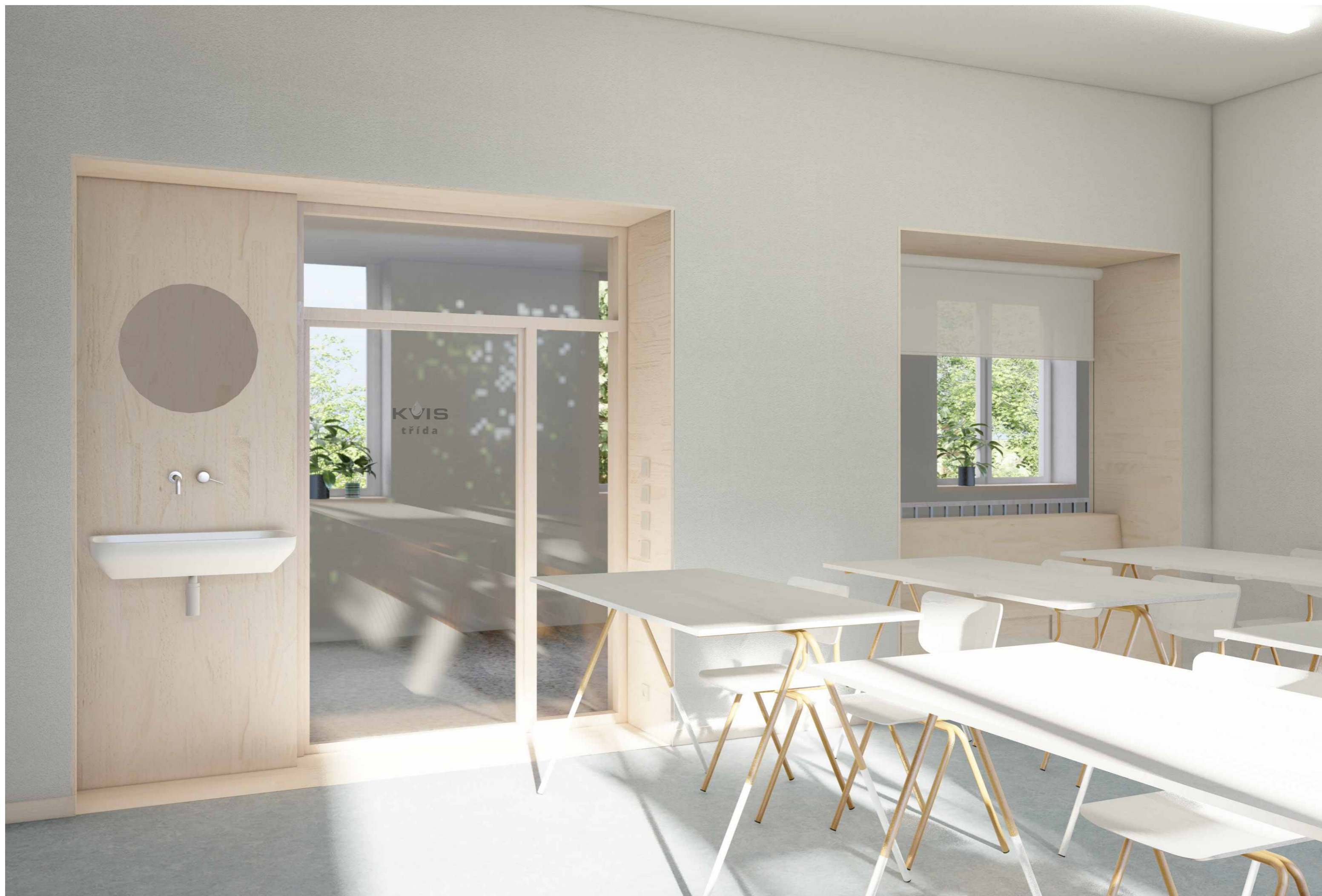
NÁVRH #03 UČEBNY STAVEBNÍ ŠKOLY VE VYSOKÉM MÝTĚ FINANCOVANÉ SPOLEČNOSTÍ KVIS PARDUBICE A.S.