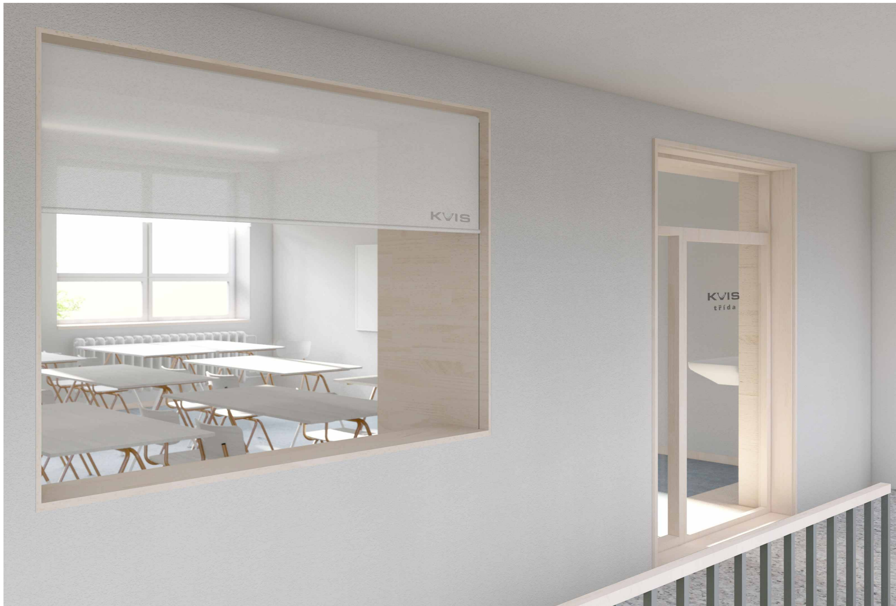
NÁVRH #03 UČEBNY STAVEBNÍ ŠKOLY VE VYSOKÉM MÝTĚ FINANCOVANÉ SPOLEČNOSTÍ KVIS PARDUBICE A.S.