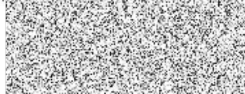
Kinsky dal Borgo, a.s. Kornanského 5 503 51 Chlumec nad Cidli, IV, IČ: 27481802 DIČ: CZ27481802