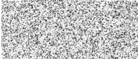
Mgr. Jana Skopalíková radní pro oblast životního prostředí a zemědělství