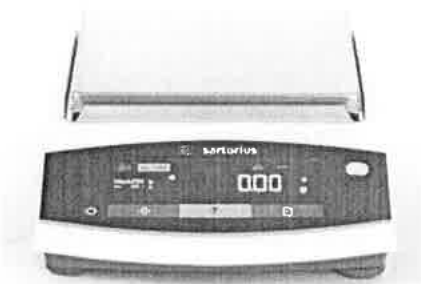
design vah Entris II s dílkem 0.1 a 0.01 g

Internet : http://www.sartalex.cz , E-mail: mrazek@sartalex.cz