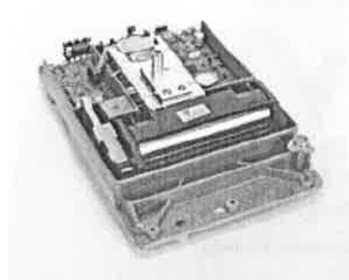
foto monolitického bloku pro uložení vážního systému pro váhy Entris II

Technické parametry nabízené váhy udané výrobcem (viz datový list strany 4 a 5)