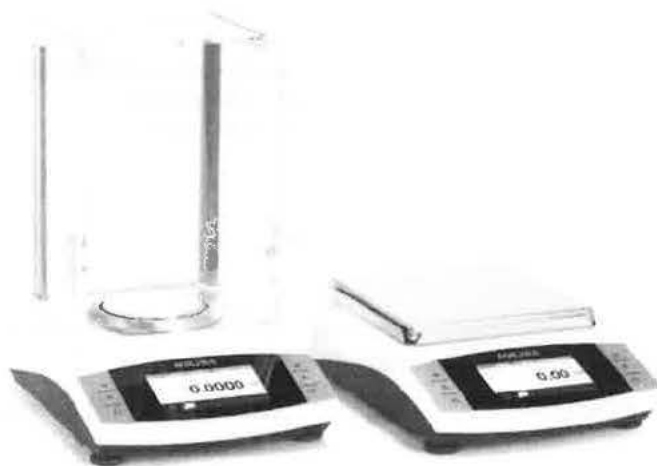
design vah Entris II Advanced

Internet : http://www.sartalex.cz , E-mail: mrazek@sartalex.cz