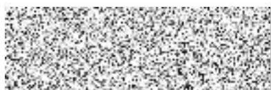
vedoucí odboru rozvoje města