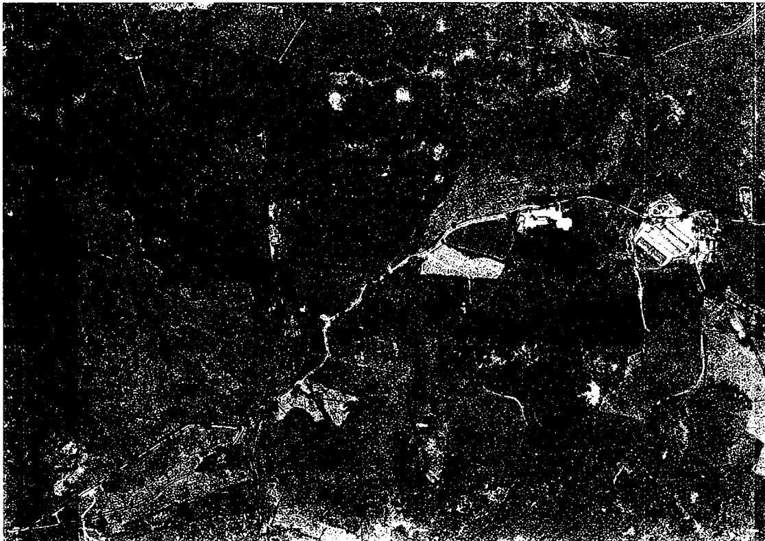
Z. Zvonková rozcestí – orientace