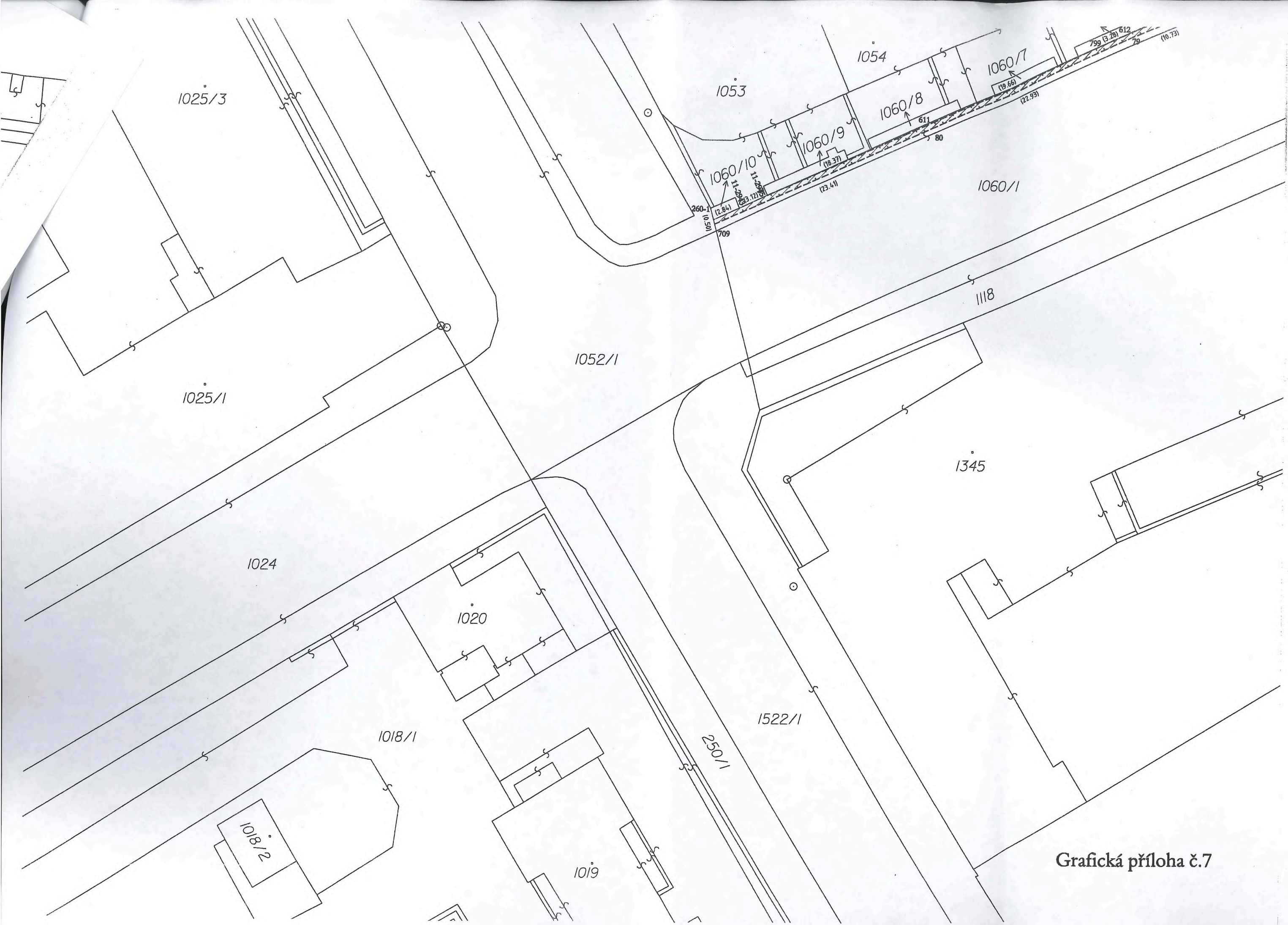
Grafická příloha č.7