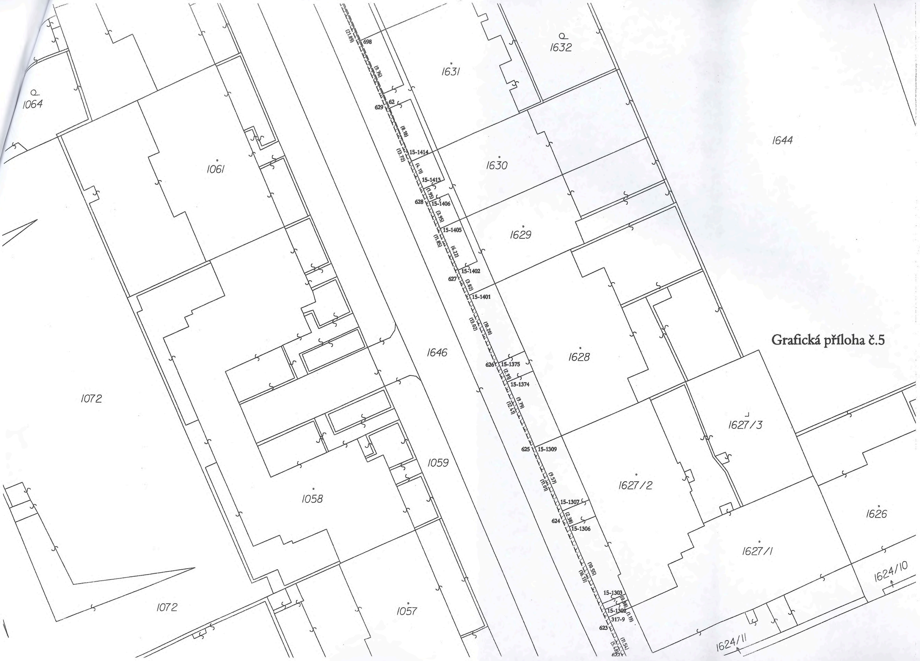
Grafická příloha č.5