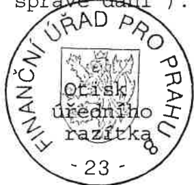
Irma Roučková pracovník odd. registrace a evidence daní

Proti tomuto rozhodnutí se můžete odvolat do 30 dnů ode dne, který následuje po jeho doručení, písemně nebo ústně do protokolu u shora uvedeného správce daně. Odvolání nemá odkladný účinek (§ 48 zákona o správě daní).