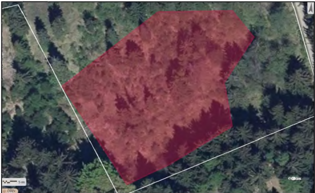
Vydavatel: AOPK ČR, RP Východní Čechy Autor: Štěpánka Haldová Rok: 2021