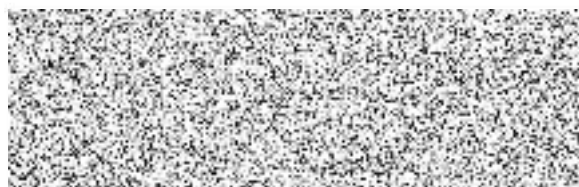
jednatelka společnosti MSS-projekt s. r. o.