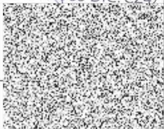
ředitel odboru firemní obchod

Česká pošta, s.p. Politických vězňů 909/4 225 99 Praha 1 421 IČ: 47114983 DIČ: CZ47114983