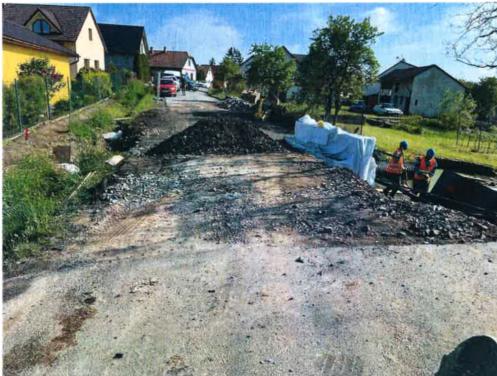
Stav prací k 20.5.2021 (9:00h)

Autorský dozor a projektant RDS souhlasí s navrženými opatřeními. Změny budou zakresleny do DSPS.