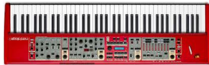
AUX 4 230V