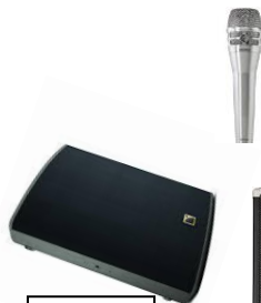
AUX 1 230V