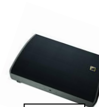
AUX 3 230V