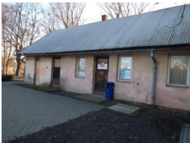
Obr. č. 4 – Pohled od nástupiště na jednopodlažní část objektu