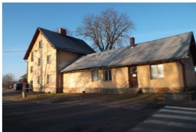
Obr. č. 3 –Pohled od ulice