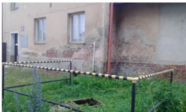
Obr. č. 6 – Pohled oplocení kolem žumpy, havarijný stav fasády objektu