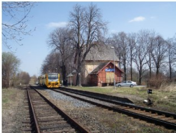
Obr. č.1 - Pohled od kolejiště