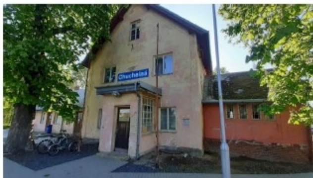
Obr. č.2 - Pohled od kolejiště – detailní záběr na fasádu budovy