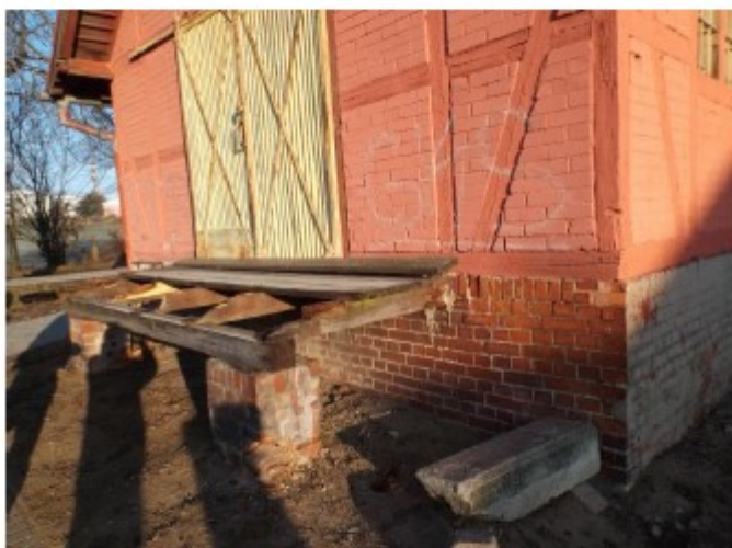
Obr. č. 5 – Pohled přístavek z hrázděného zdiva, havarijný stav rampy