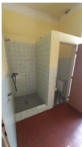
Obr. č. 8 – Interiér – zastaralé sociální zázemí pro dopravce