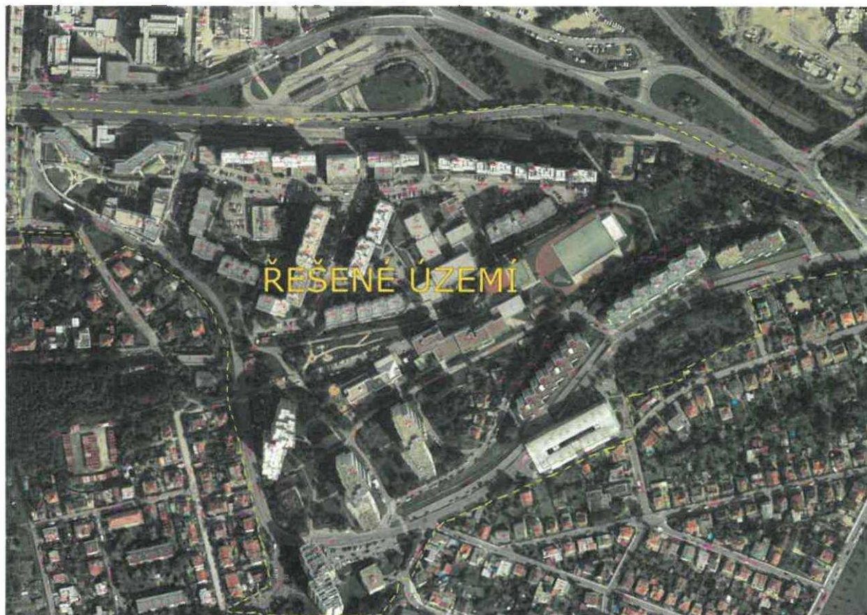
Příloha: č. 1 - Mapa řešeného území