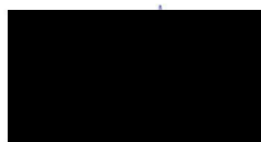
člen Zastupitelstva městské části Praha 4