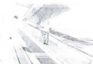
Eskalatory & pohyblivé chodníky