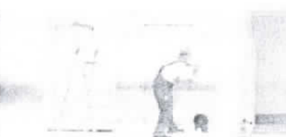
Servis 24 hodin