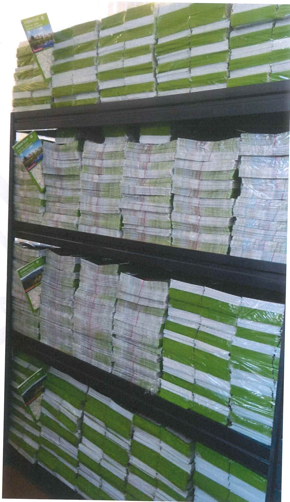
Mapa č.3, č. 5