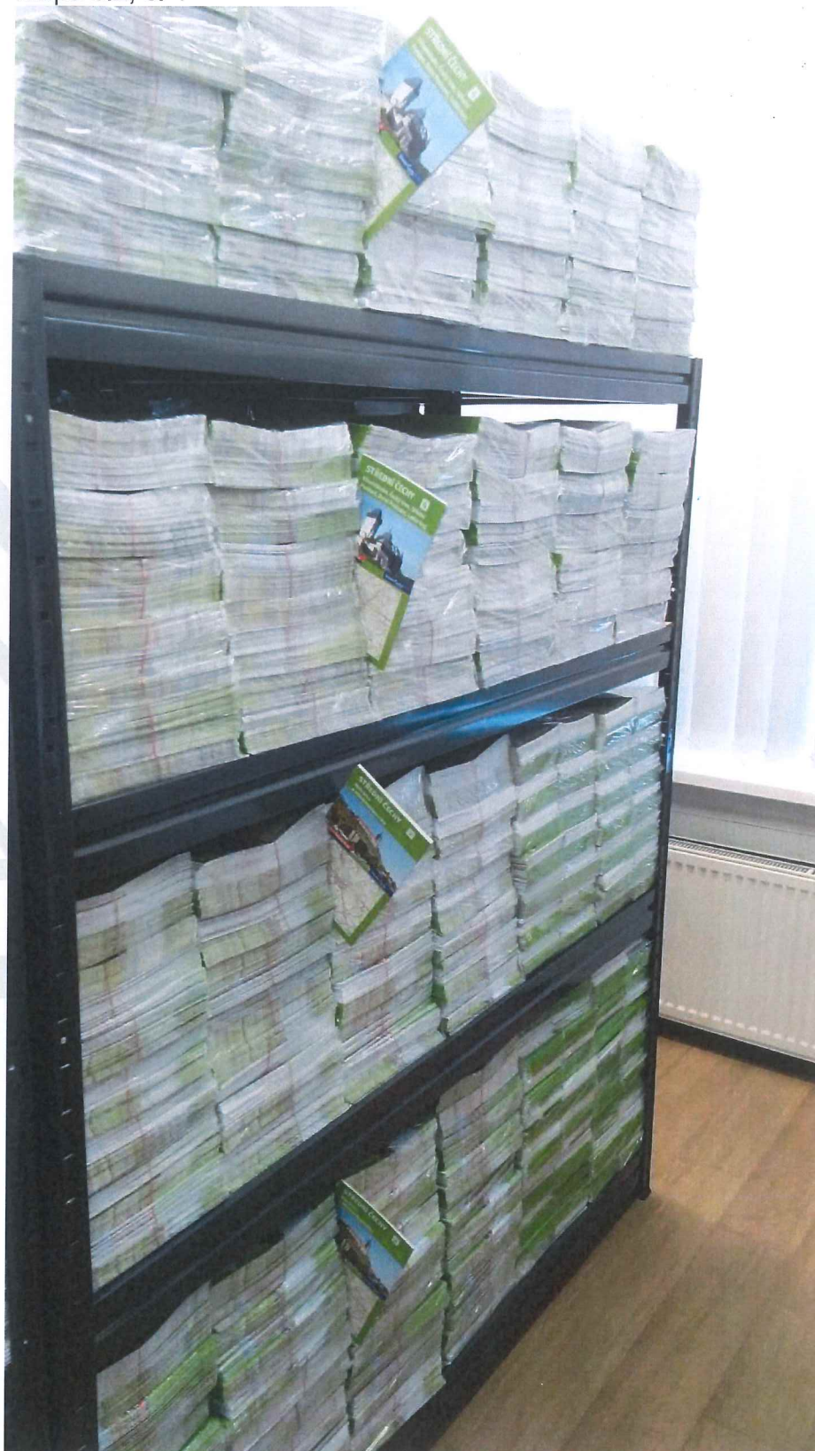
Mapa č.2, č. 4