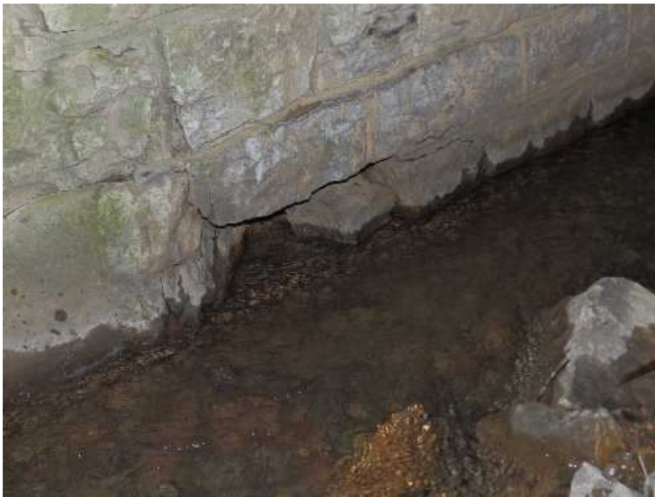
Vypadlý kámen v OP1.