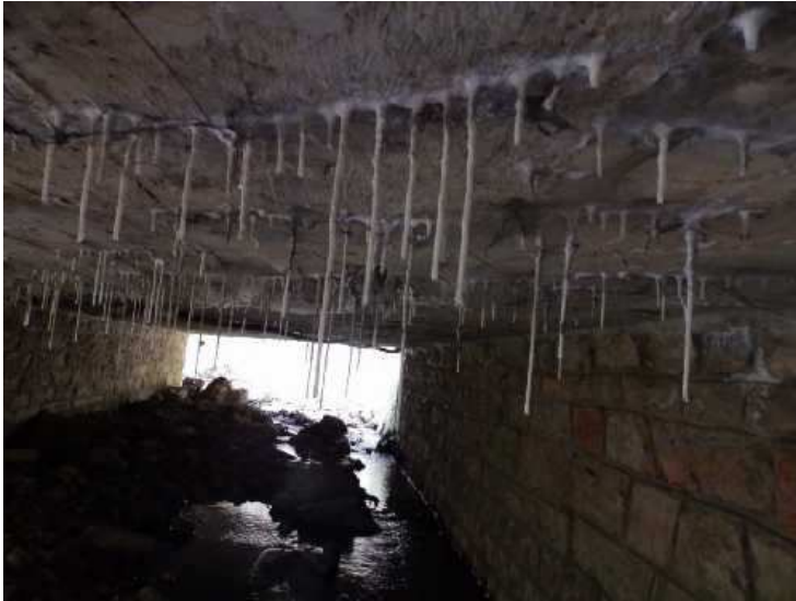
Silné průsaky s inkrustací a krápníčky na levé straně mostu.