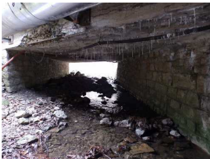
Pohled do mostu. Nánosy kamenů v korytě potoka. Silná degradace betonu na čele NK.