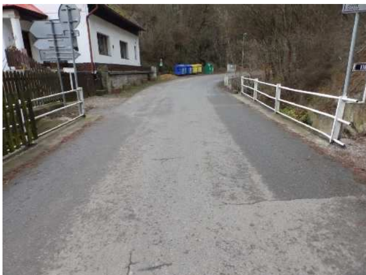
Prostorové uspořádání na mostě. Pohled ve směru staničení.