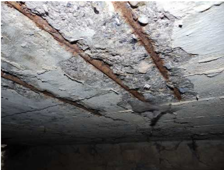
Degradace betonu, separace krycí vrstvy, koroze odhalené výztuže na pravé straně mostu.