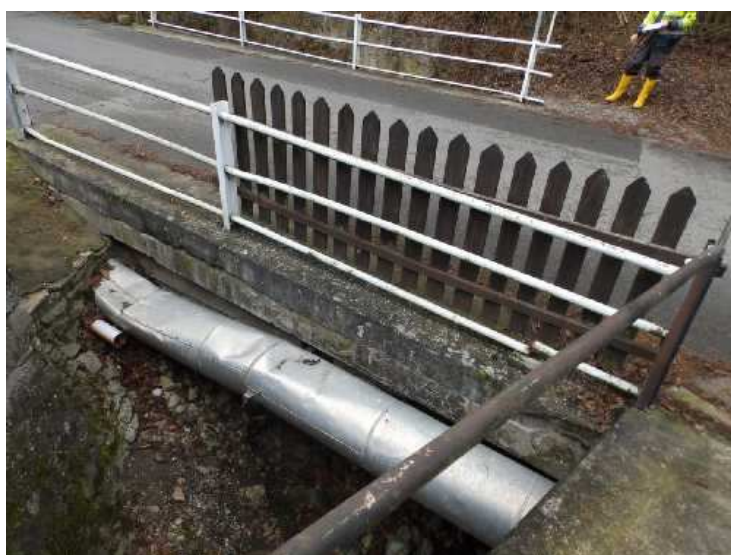
Pohled na levou stranu mostu. Zábradlí neodpovídá ČSN.