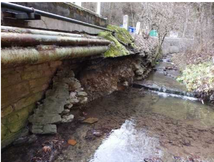
Totální rozpad kamenného opevnění u pravého křídla OP2.