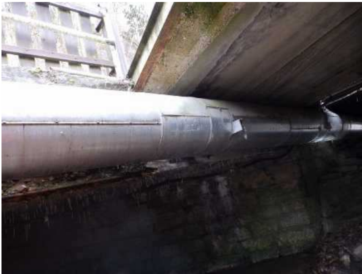
Na levé straně NK je uložena jiná konstrukce (vjezd do domu).