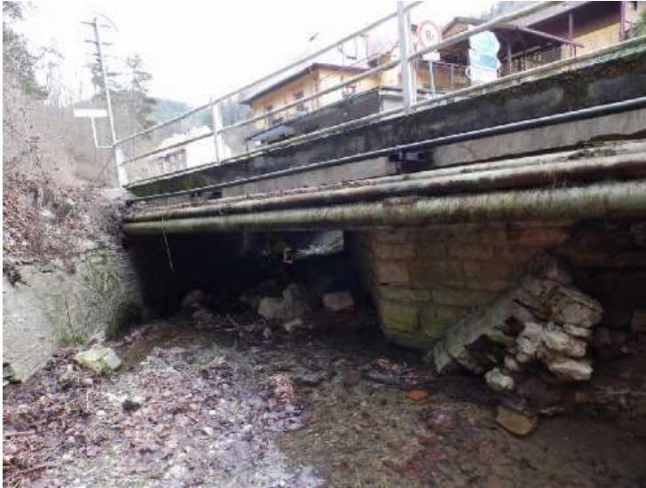
Pohled na pravou stranu mostu.