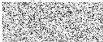
mg. Karel Janák statutární zástupce Život plus, z.ú.

Za správnost dokumentu zodpovídá: Kontrola právníkem dne: 9.4.2021