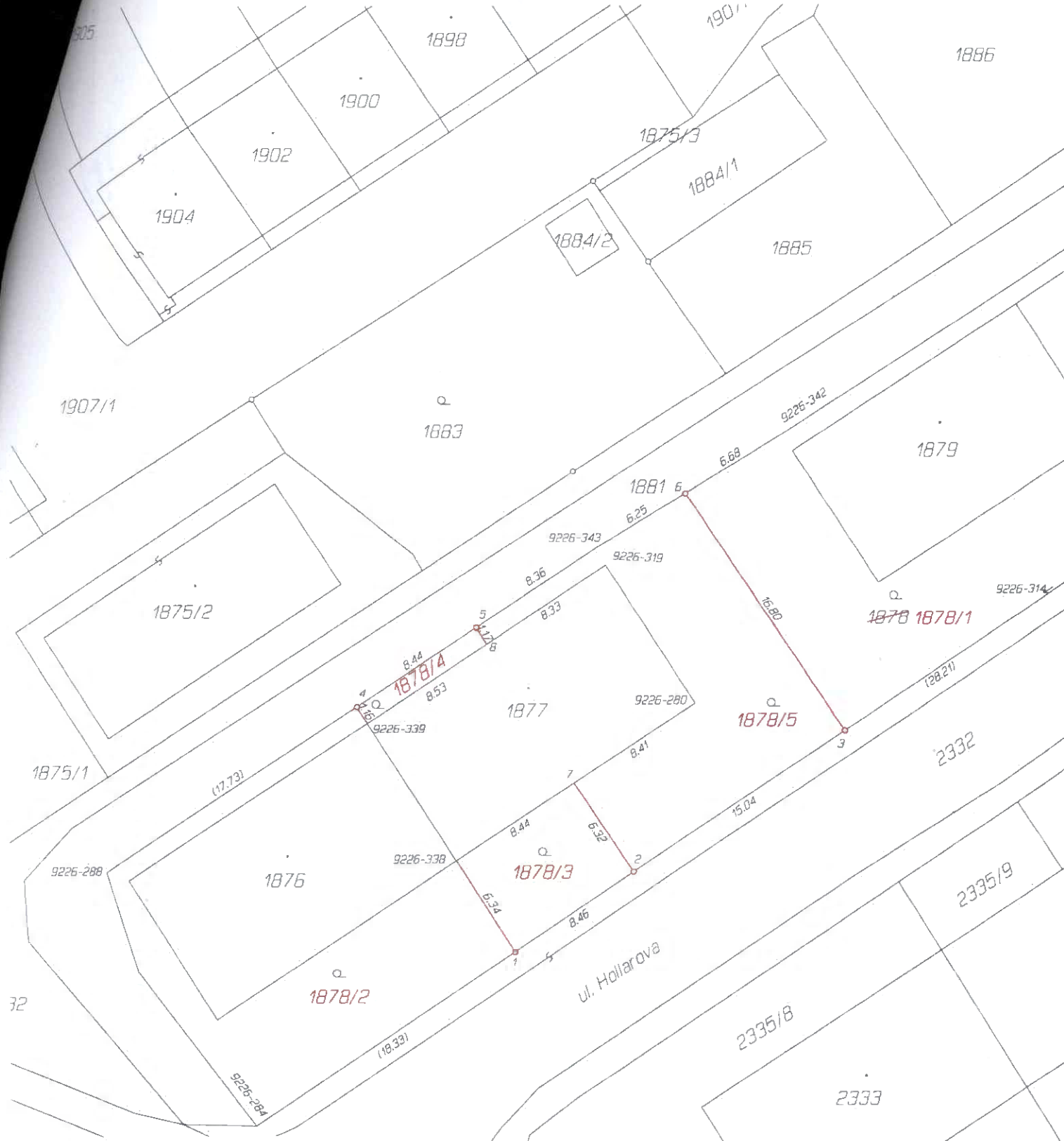
Seznam souřadnic (S-JTSK) Číslo bodu Souřadnice pro zápis do KN