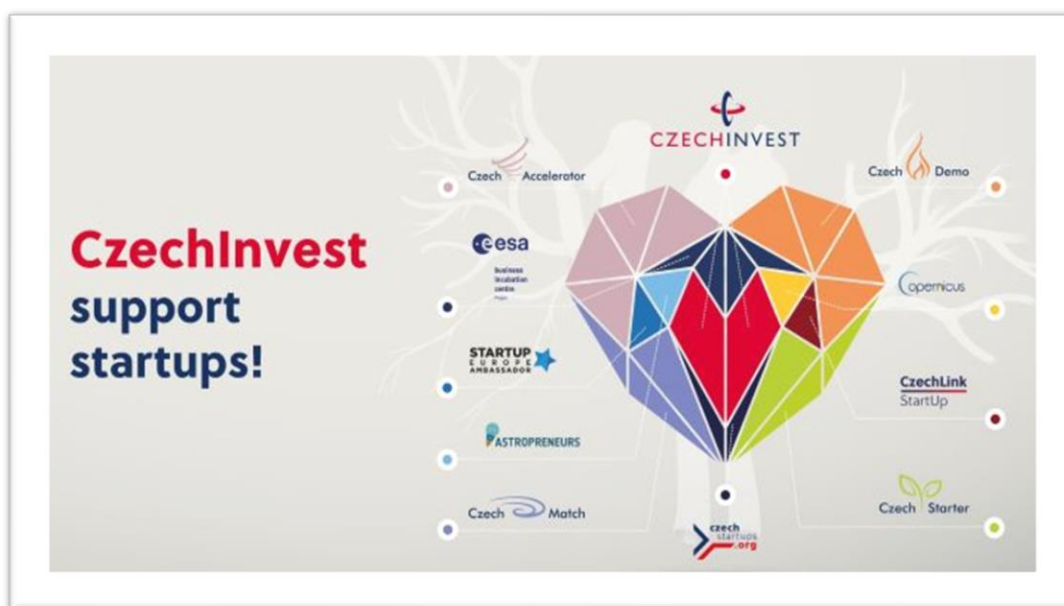
Obrázek 1 Přehled programů pro startupy.

CzechAccelerator – V rámci tříměsíčního akceleračního programu v zahraničí jsou poskytovány kancelářské prostory, odborný mentoring, poradenství a workshopy, kde dochází k čerpání know-how od místních expertů. Dále jsou zřízeny vstupy na networkingové akce, překlady, poradenské služby v oblasti ochrany duševního vlastnictví a letenky do destinace. To vše za účelem pomoci s expanzí na zahraniční trhy. Cílové destinace: Londýn, New York, San Francisco, Singapur.