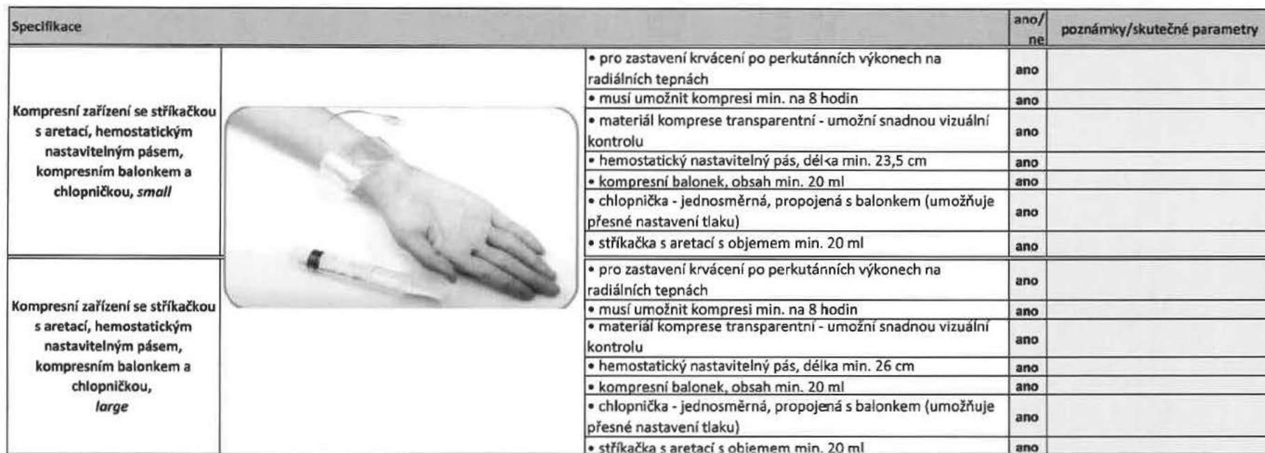
Tabulka splnění minimálních technických podmínek VZMR VZ-2021-000319 "Kompresní zařízení pro zastavení krvácení po perkutánních výkonech na radiálních tepnách"