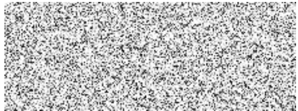
Plavecká škola Jihlava s. r. o. (dodavatel)