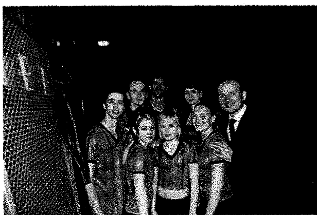
setkání se sourozenci Gondíkovými