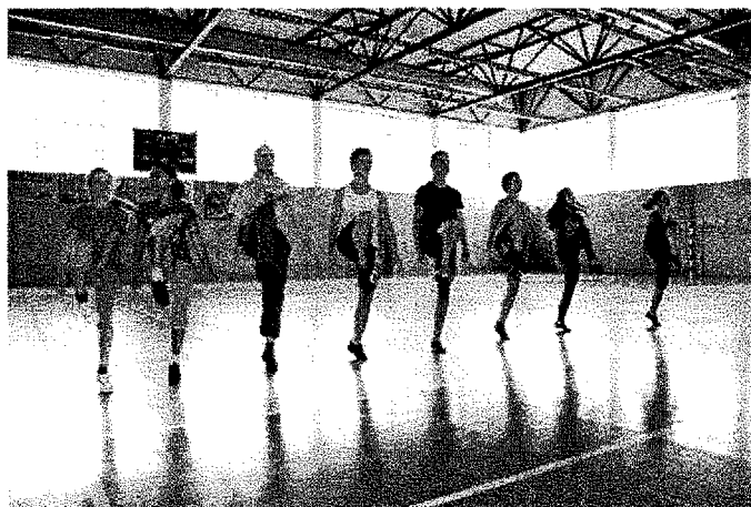
nácvik tanečních dovedností

Zájemci o činnost ve sdružení se mohou naučit různým druhům tanců, ze kterých jsou sestavována různá předtančení a představení. Prioritou je akrobatický rokenrol, kterému se věnují členové na soutěžní úrovni a účastní se republikových soutěží, ale také světových pohárů, mistrovství Evropy a mistrovství světa.