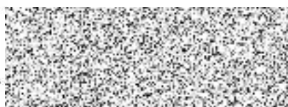
Mgr. Jana Skopalíková radní pro oblast životního prostředí a zemědělství