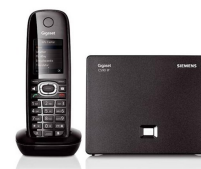
Bezdrátová služební jednotka IP 110600.01 / BSJ IP