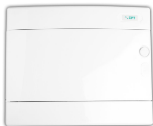
Napáječ 250W 24V IP 110090.01 / N250 IP