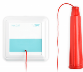
Táhlo nouzového volání IP 110410.02 / TANV IP