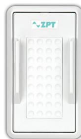
Závěs LJ bez konektoru IP 110130.01 / ZLJ IP