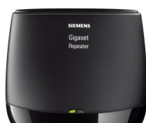
Opakovač BSJ IP 110601.01 / OBSJ IP