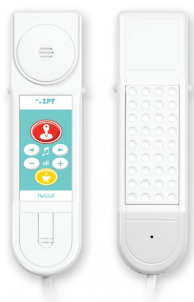
Lůžková jednotka IP 110114.01 / LJ IP