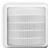
Svítilno IP 110441.01 / SV IP