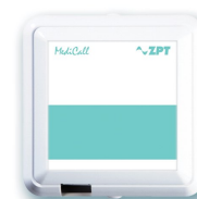
Zásuvka účastníka IP 110190.01 / ZU IP