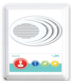
Komunikační jednotka IP 110210.02 / KJ IP