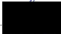
.....atel OMEGA & partners s.r.o.

OMEGA & partners s.r.o. ana Růžičky 1143/17, Praha - 010 CZ2517028