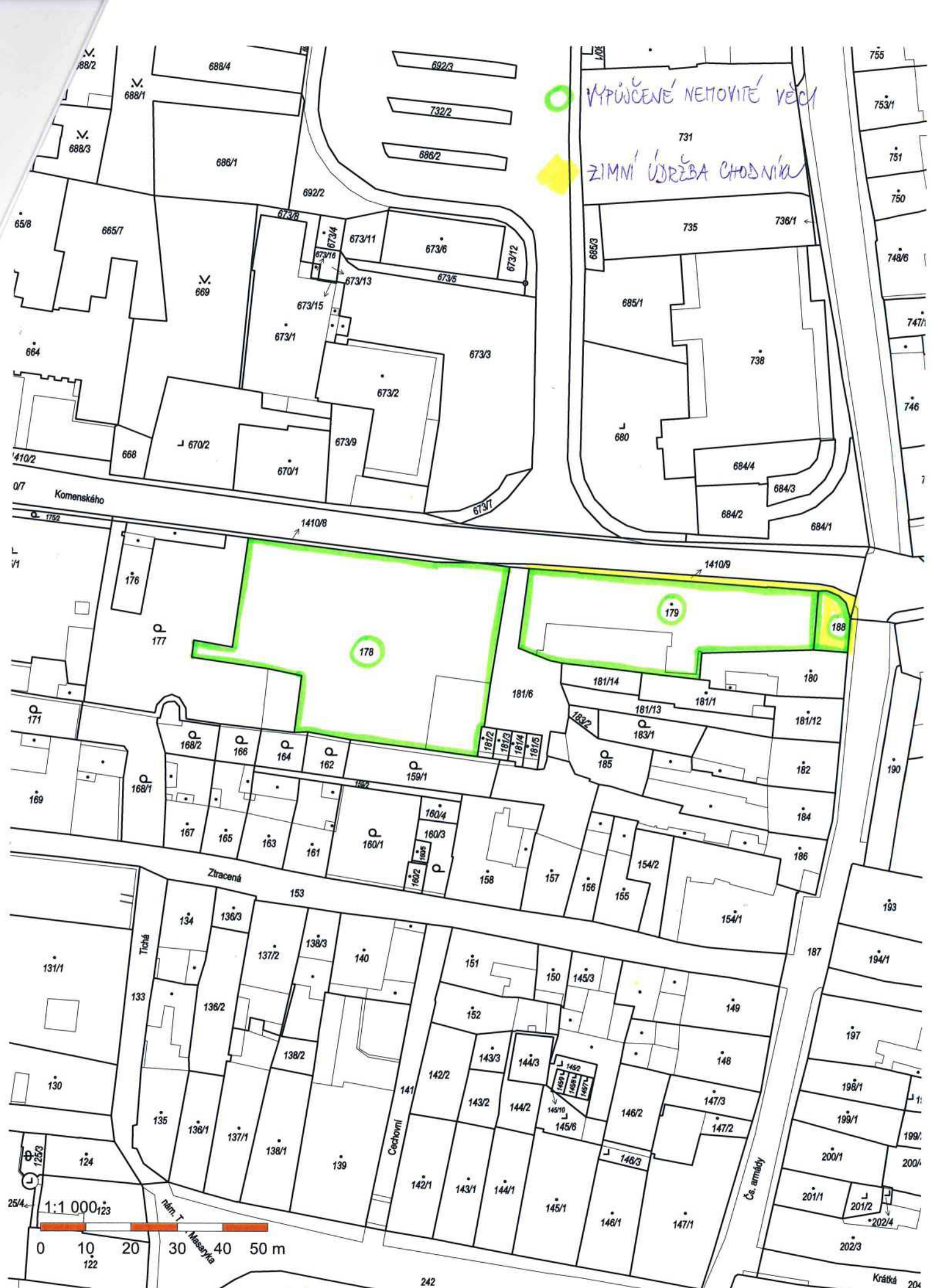
PRÍLOHA č. 1 - SITUACE