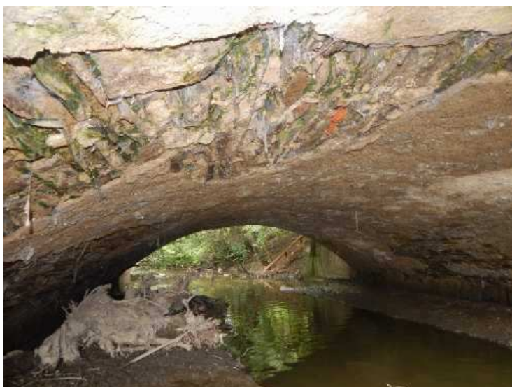
Poruchy v nosné konstrukci na pravé straně, silné zatékání, rozvolněné zdivo.