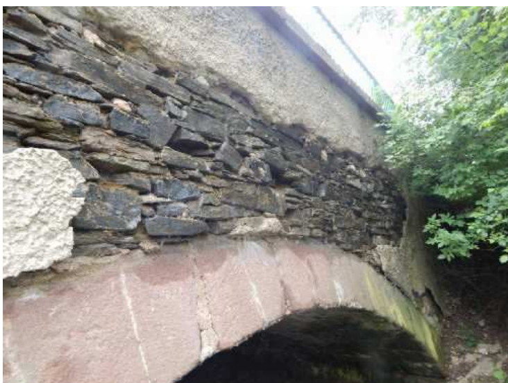
Plošně vypadlé spárování čelní zdi, jednotlivé kameny se uvolňují – ztráta stability čelní zdi.