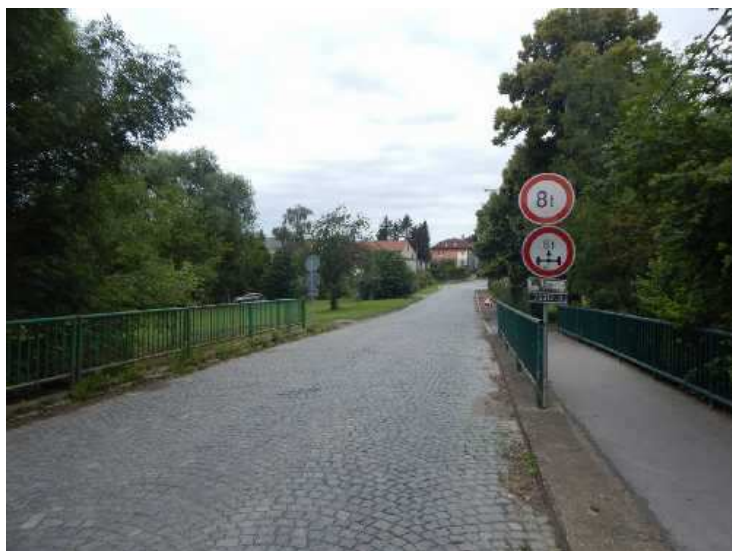
Šířkové uspořádání proti směru staničení.