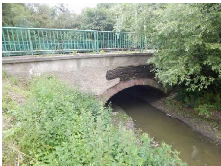
Pohled na pravý bok mostu.