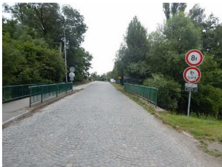
Šířkové uspořádání ve směru staničení.