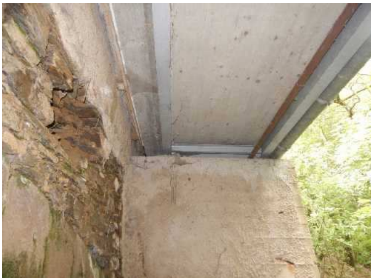
Spodní líc nosné konstrukce lávky.