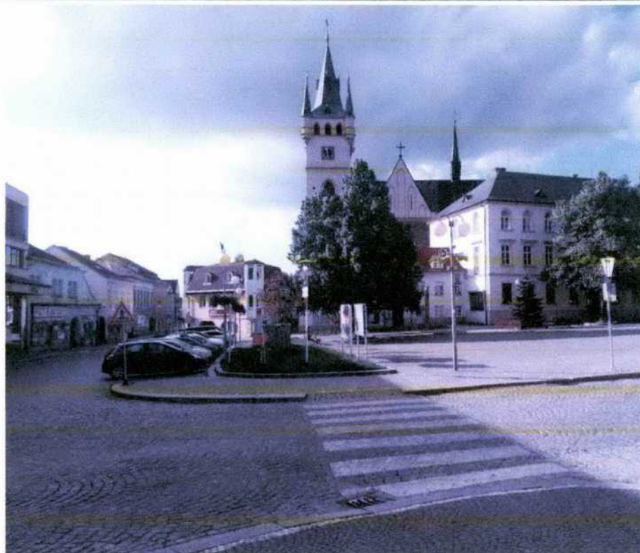
Na travnatém ostrůvku vlevo vedle dvou informačních tabulí.