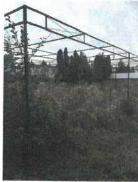
konstrukce k zastínění rostlin