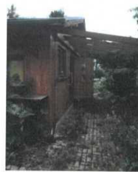
Prodejna zahradních potřeb