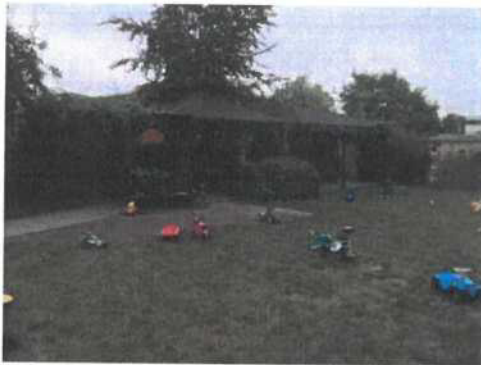
občerstvení s přístřeškem a pergolou