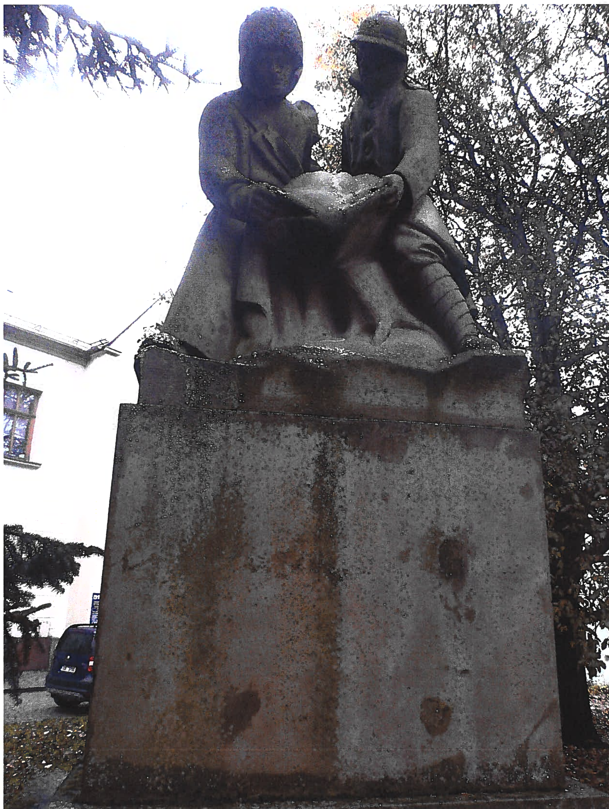
Pomník padlým vojínům – Pohřeb v Karpatech Současný stav, detail sousoší, čelní pohled