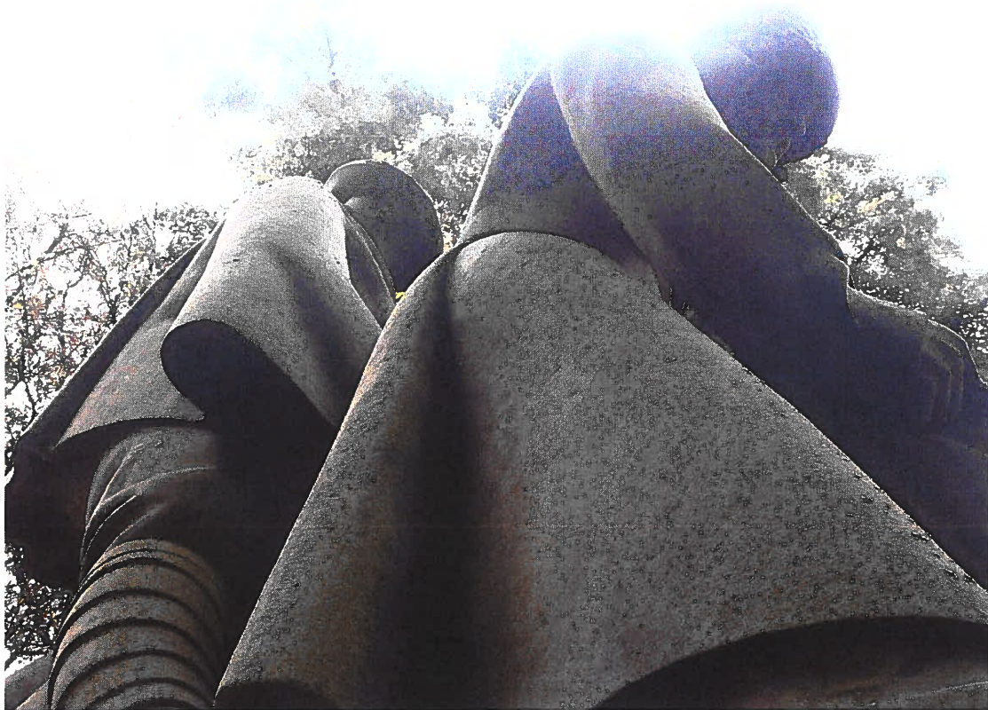
Pomník padlým vojínům – Pohřeb v Karpatech Současný stav, detail sousostí, biologické znečištění