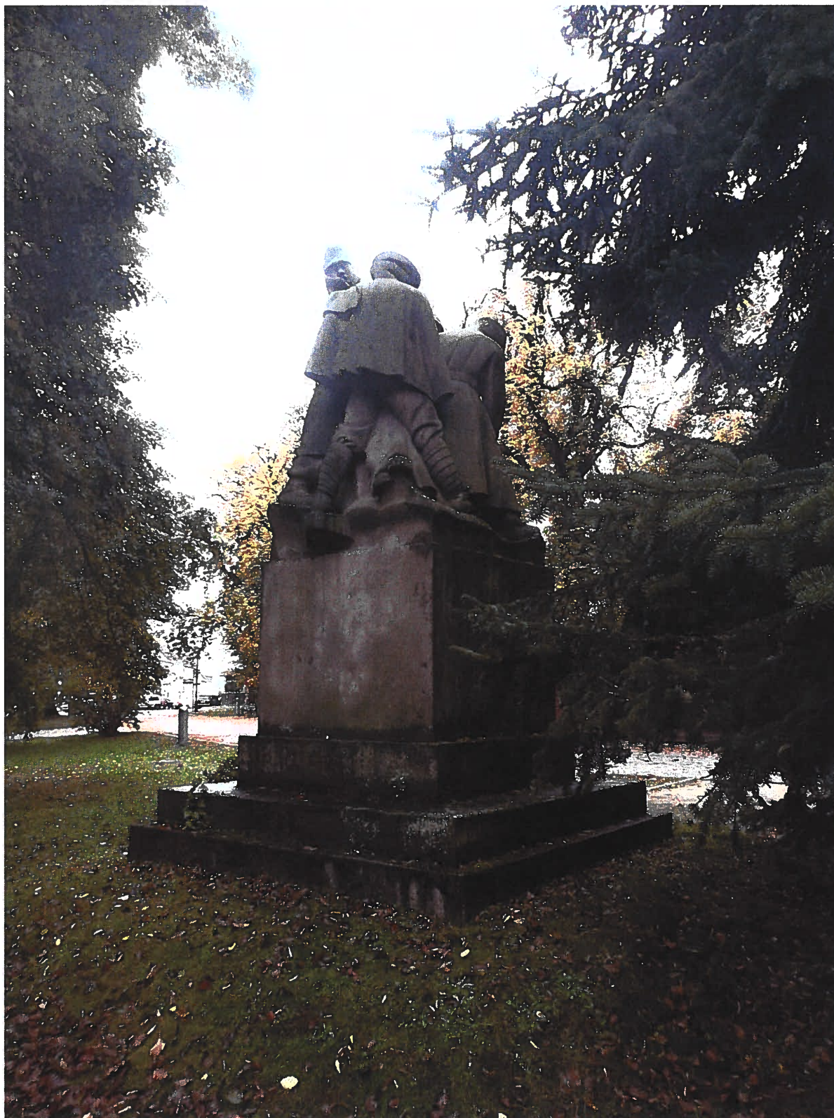
Pomník padlým vojinům – Pohřeb v Karpatech Současný stav, zadní pohled