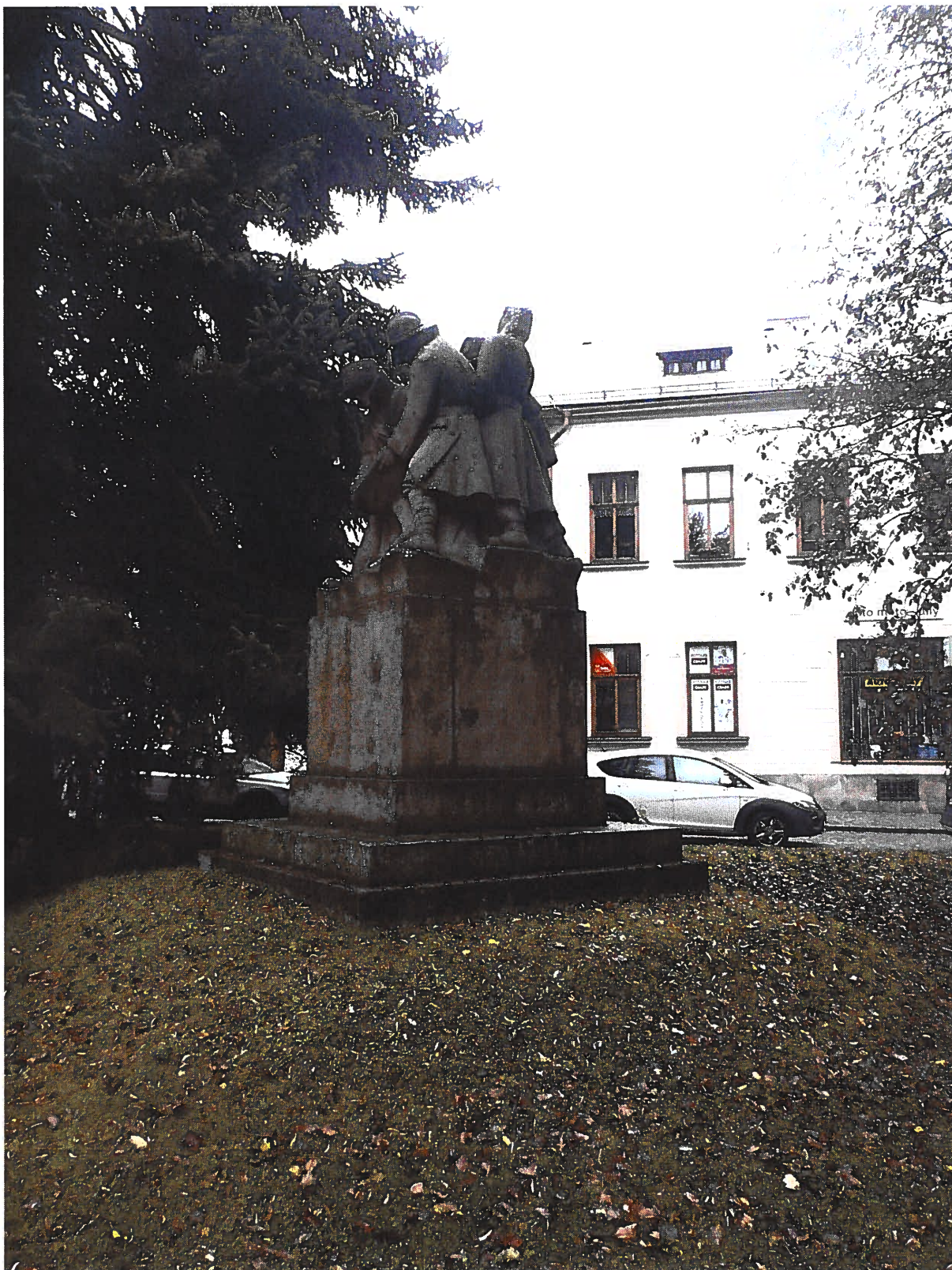
Pomník padlým vojínům – Pohřeb v Karpatech Současný stav, boční pohled