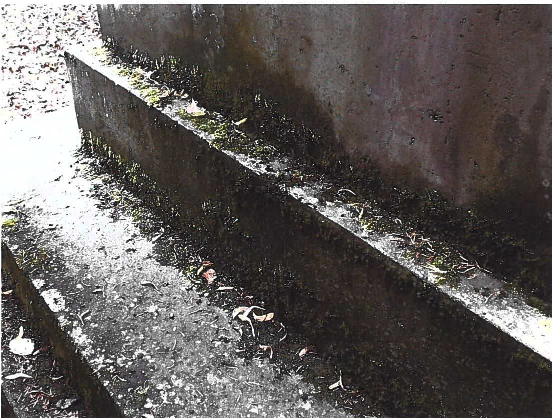
Pomník padlým vojínům – Pohřeb v Karpatech Současný stav, detail základny, biologické znečištění