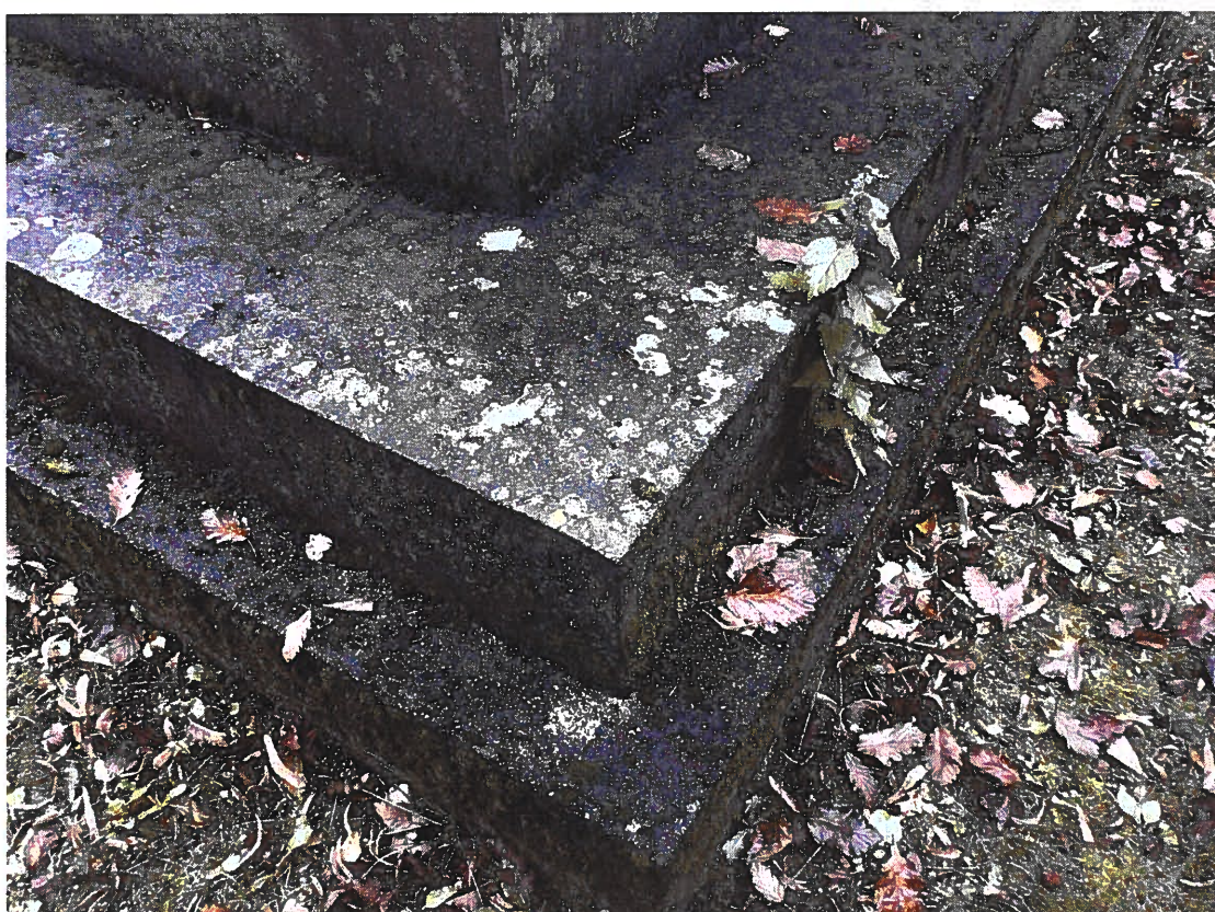
Pomník padlým vojínům – Pohřeb v Karpatech Současný stav, detail podstavce a základny, biologické znečištění