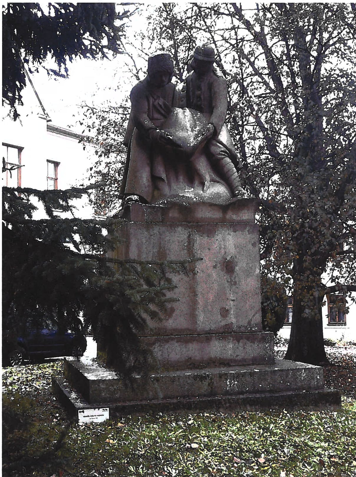
Pomník padlým vojínům – Pohřeb v Karpatech Současný stav, čelní pohled