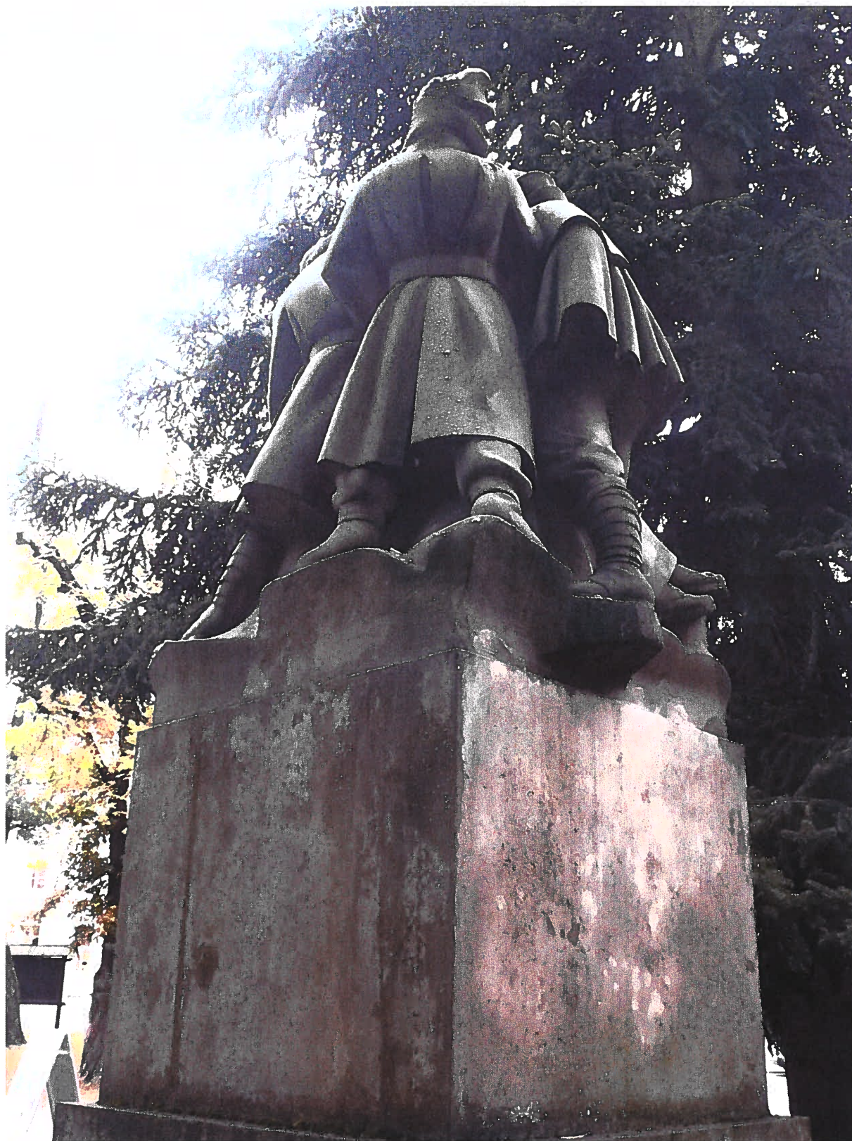
Pomník padlým vojínům – Pohřeb v Karpatech Současný stav, detail sousoší, zadní pohled