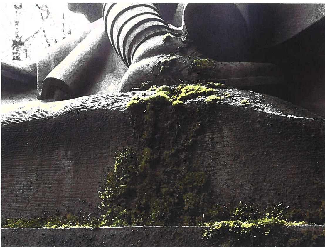
Pomník padlým vojínům – Pohřeb v Karpatech Současný stav, detail sousoší, biologické znečištění