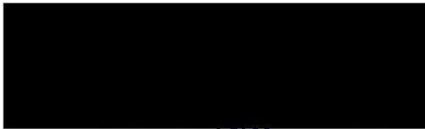
Mgr. Juraj Thoma, náměstek primátora statutární město České Budějovice