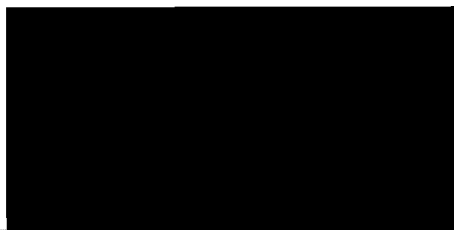
Severočeské vodovody a kanalizace, a.s. [redacted] ředitel inženýrsko-projektových činností Objednatel