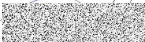
Bc. Michal Boudný