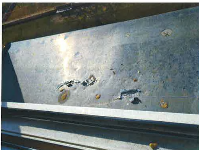
foto /1/ Koroze TiZn parapetů