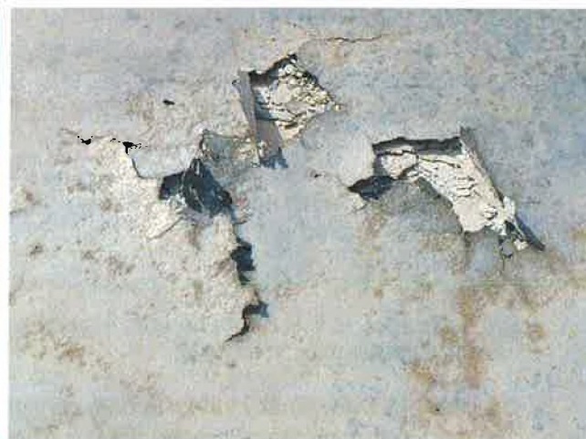
foto /2/ Koroze TiZn parapetů