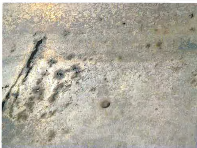
foto /4/ Koroze TiZn parapetů