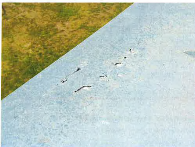
foto /3/ Koroze TiZn parapetů